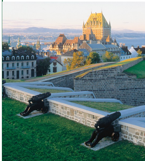
Panorama de la ville observé des plaines d'Abraham de Québec